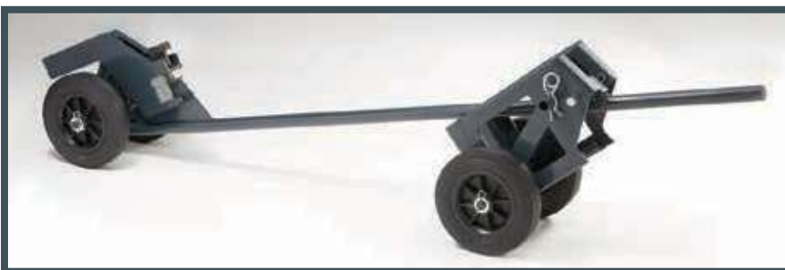
• Der Handtransportwagen