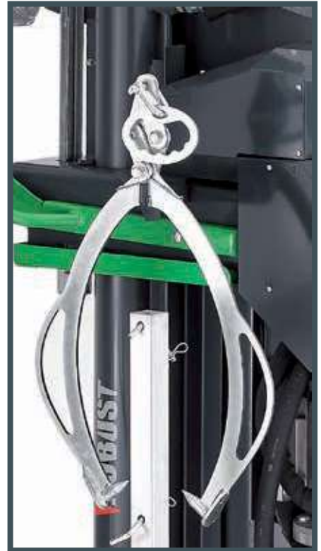
• Spaltholzmaschinenzange und Zangenträger