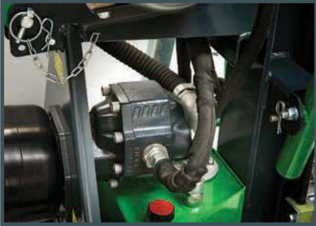
• Gusseisen Pumpe