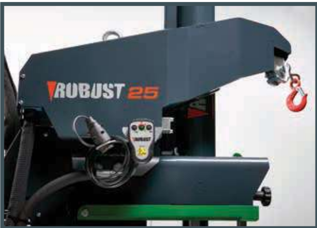
• Die Hydraulikholzspaltmaschine (540 kg, 15 oder 20 m) – mechanische oder Fernsteuerung