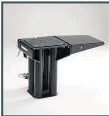
• Spalttisch für kürzere Holzscheite und Feuerholze, die Verbreiterungsmöglichkeit