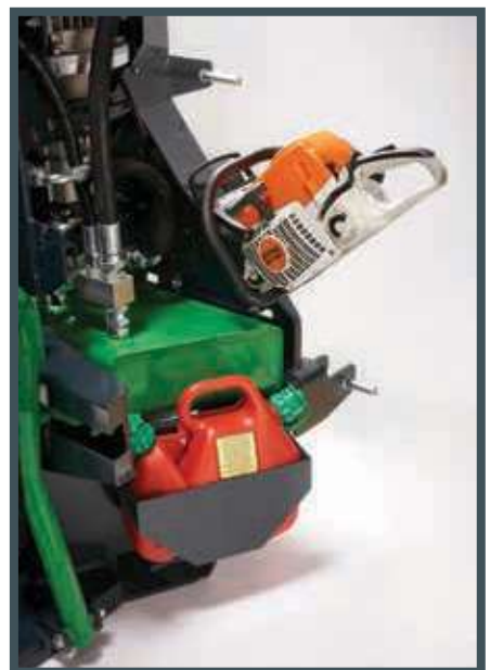
• Der Kanister Träger