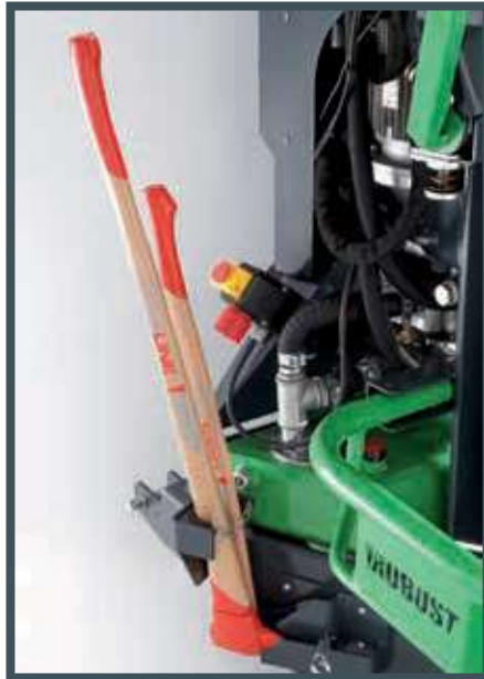
• Der Axt- und Spaltmaschinenträger