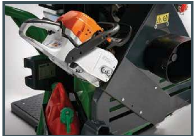
• Der Sägeträger